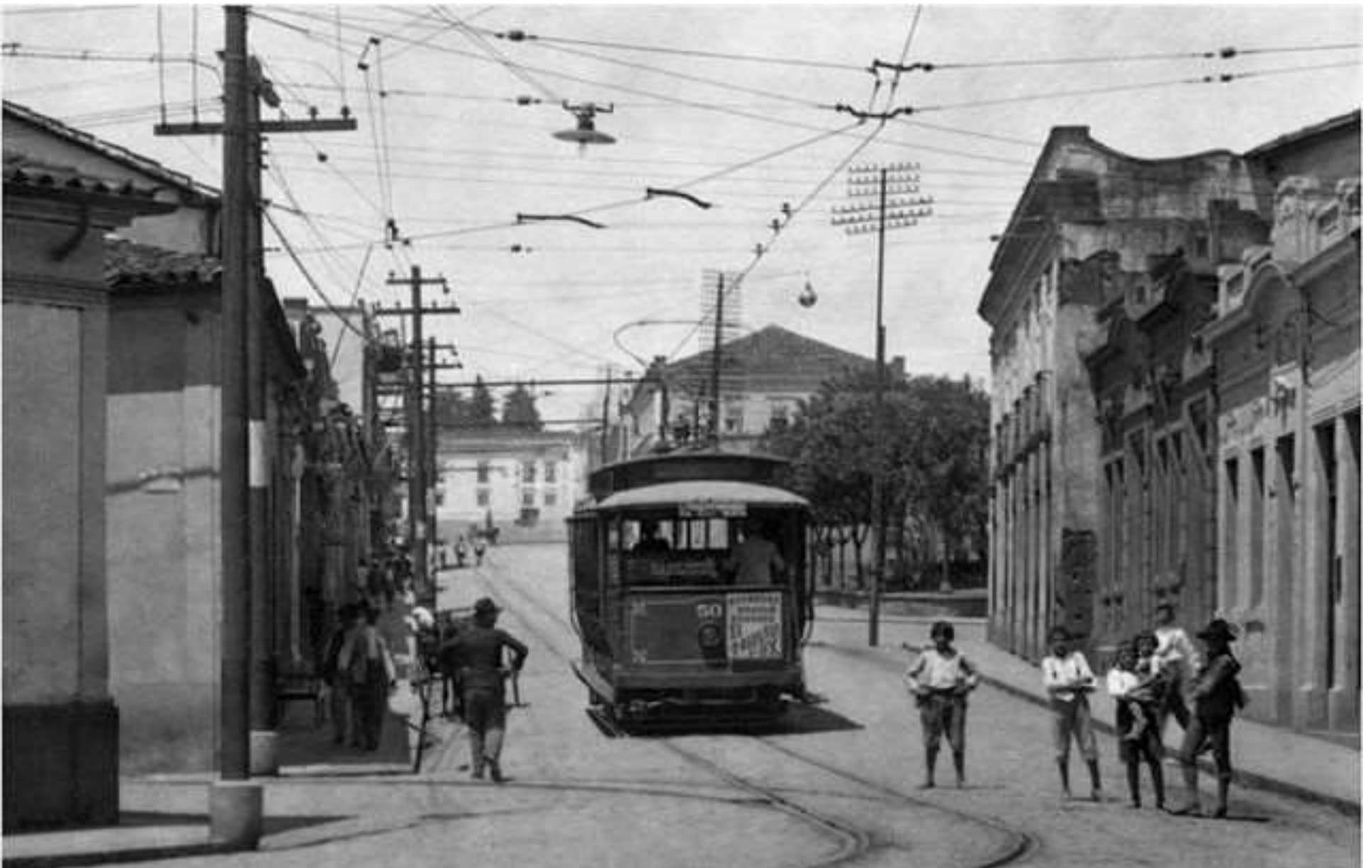
1924 - RUA DE SÃO BENTO - CENTRO