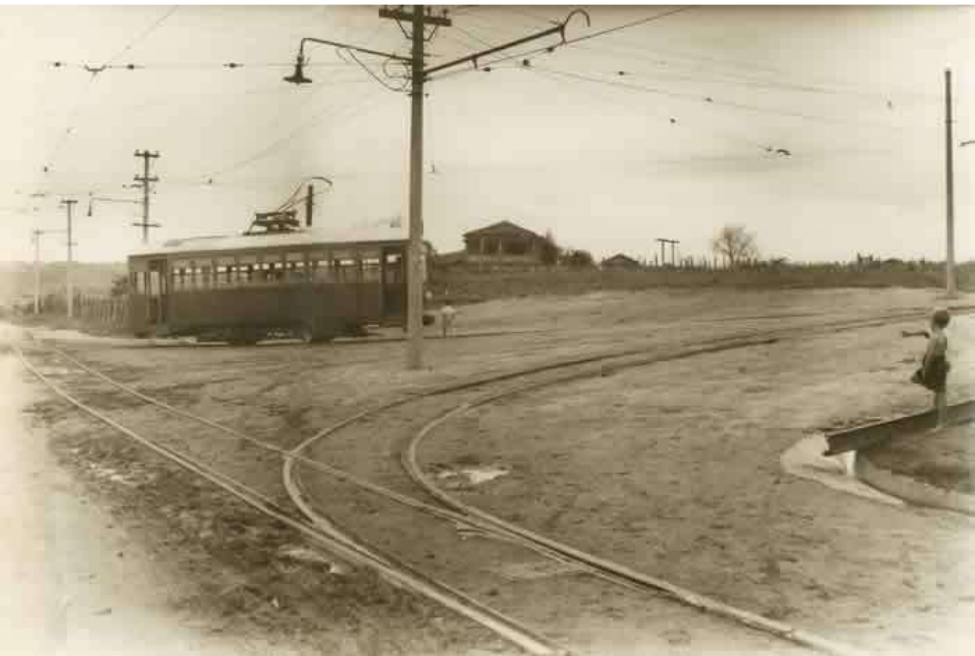
EM MANOBRAS NA R. CÉL. NOGUEIRA PADILHA (Adicionada à este arquivo)